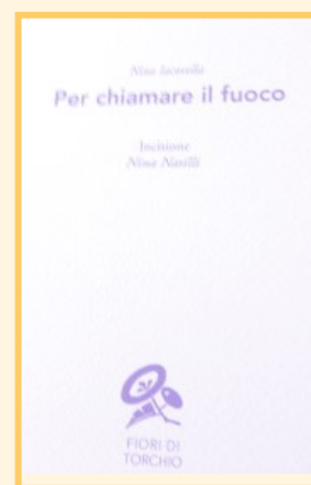
L'ultimo volume n. 64